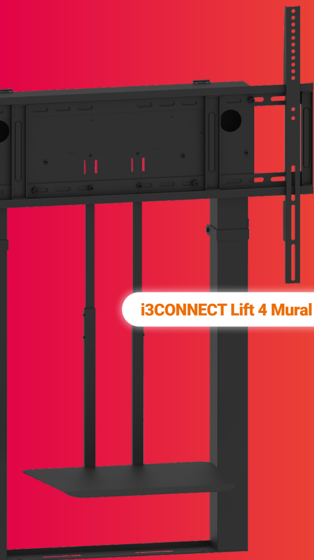
i3CONNECT Lift 4 Mural