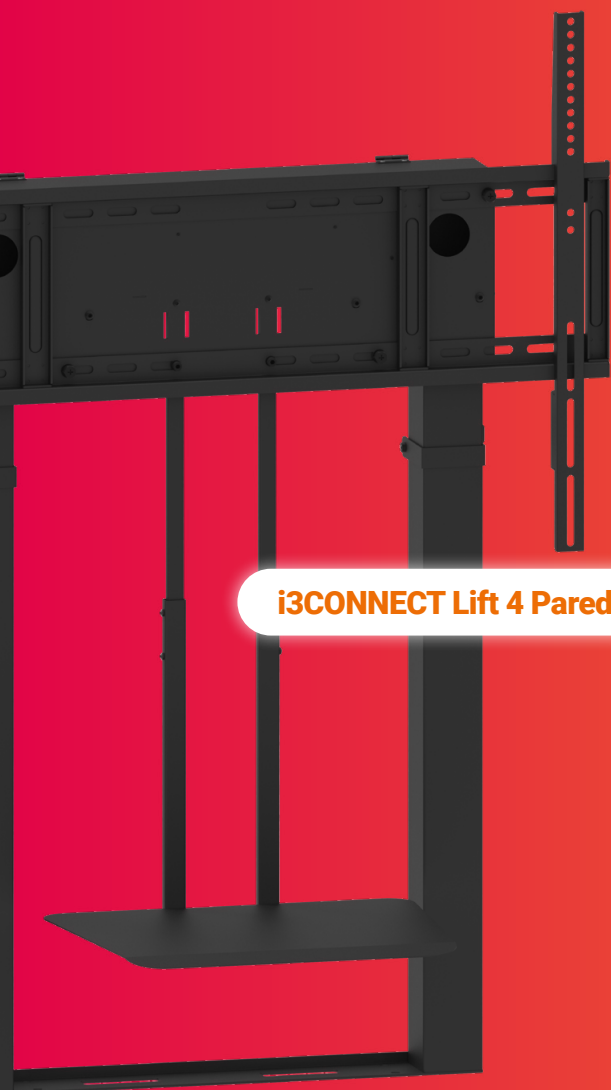
i3CONNECT Lift 4 Pared